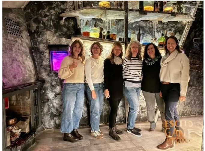
Bild 18: Glückliche Gesichter der Mitarbeiterinnen* nach dem erfolgreichen Lösen des Escape Rooms

Innenstadt konnten wir uns bei einem gemeinsamen Mittagessen und anschließenden Café-Besuch austauschen und den Tag ausklingen lassen.