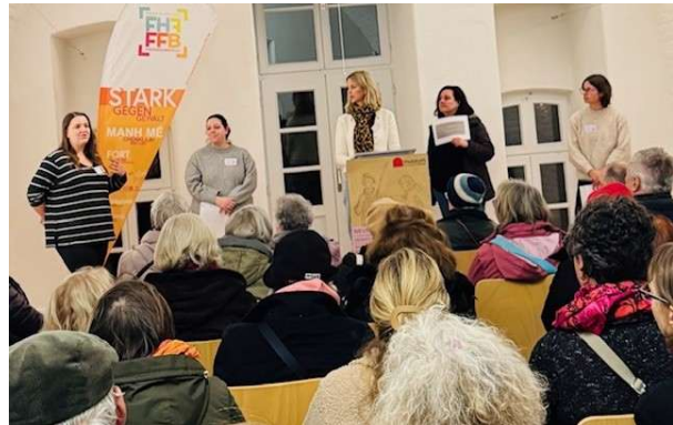
Bild 5: Vertreterinnen* des Vereins berichten von der aktuellen Lage