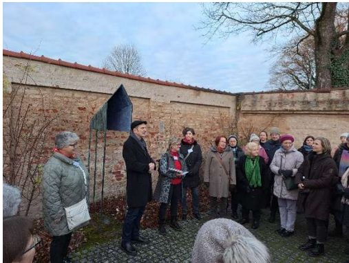
Bild 4: Fürstenfeldbrucker Oberbürgermeister Götz bei der Begrüßung der Anwesenden

Brabant und das ihr gewidmete Denkmal sowie über Ludwig den Strengen erfuhren. Im Museum endete die Führung und ging über zur aktuellen Lage bezüglich Gewalt an Frauen und Femiziden in Deutschland. Die erfolgreiche Veranstaltung endete mit einer Abschlussrunde, in der alle Anwesenden angehalten waren, konkrete Handlungsmöglichkeiten zu entwickeln, wie jeder und jede gegen Gewalt an Frauen* vorgehen kann. Hieraus entstand ein bunter Blumenstrauß an Inspirationen, konkreten Tipps und Vorgehensweisen.